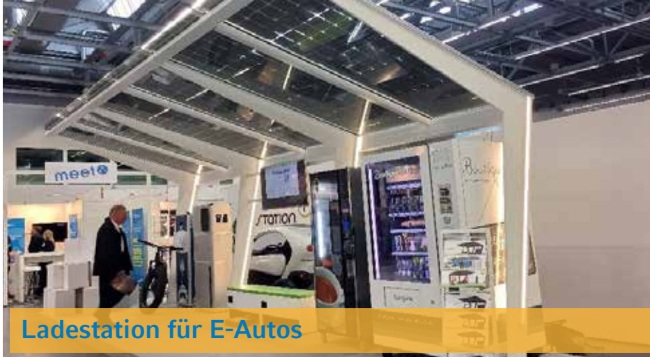
Ladestation für E-Autos