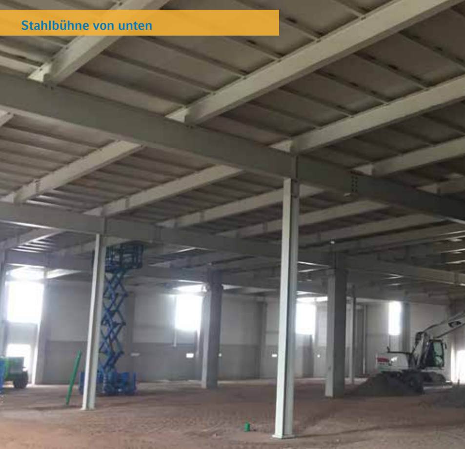
Stahlbühne von unten